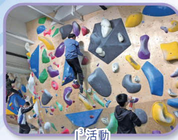
I 3 活動

中聖書院發掘每位學生獨特潛能，藉各式各樣的活動和訓練，全面培育學生，以期推己及人，尊己立群。