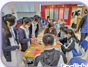
English is Cool