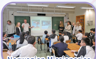
Norwegian Missionaries visiting CHC 挪威宣教士 探訪中聖書院