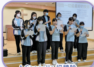
A Cappella 初體驗