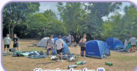
Glamping fun fun 樂